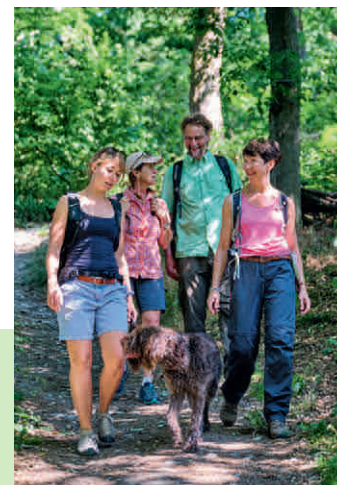
Auf Wegen und Pfaden durch die Kulturlandschaft

felskanzel, die – trotz schaurigem Namen – einen der traumhaftesten Ausblicke über das Rhein-Main-Gebietes bietet. Wer sich vom Panorama wieder lösen kann und sich zurück auf die Wege des Heilklima-Parks begibt, entdeckt geologische Zeugen in den Geröllfeldern der letzten Eiszeit, antike Geschichte in den Relikten keltischen und römischen Lebens und eben das stimulierende Klima, das zum tiefen Durchatmen anregt.