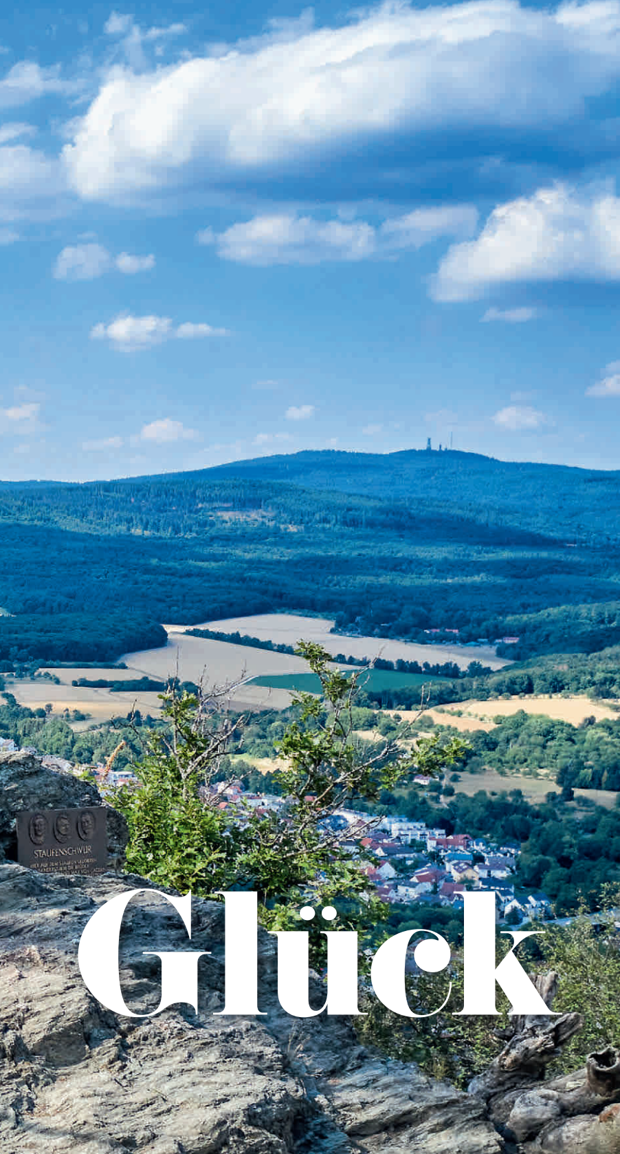
Panorama vom Großen Mannstein in Kelkheim