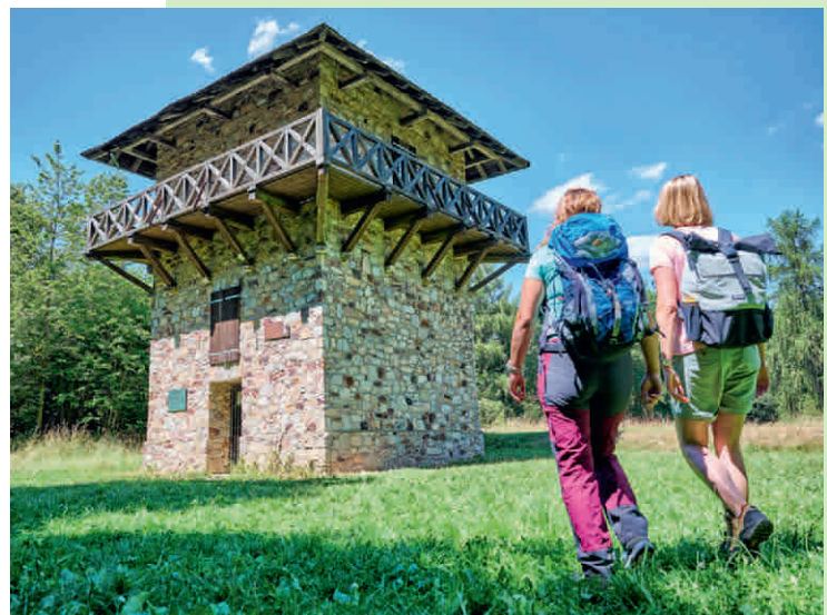
In der Saalburg wird römische Geschichte lebendig