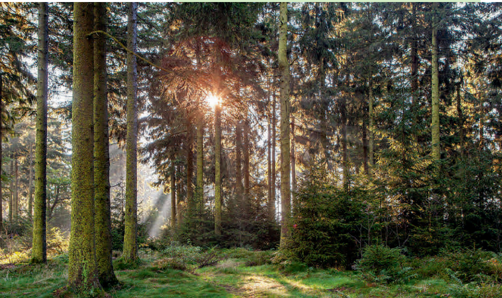
Idyllisches Wispertal