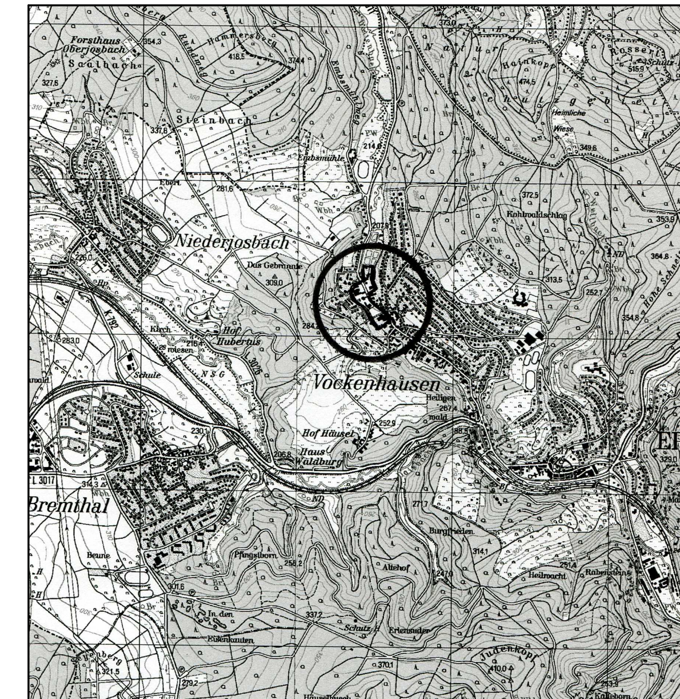
Übersichtskarte (Maßstab 1 : 25.000)